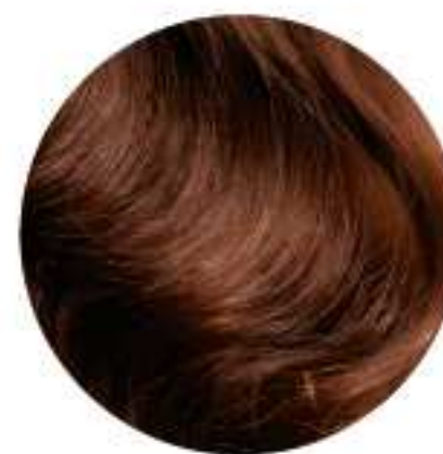
Cisteamina Presente en el líquido de permanente, reduce los enlaces disulfuros.