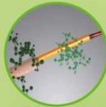
3W-GAMMA KEARTIN TECHNOLOGY