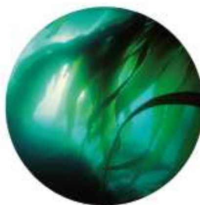
Sea Complex™ Complejo natural de origen marino.